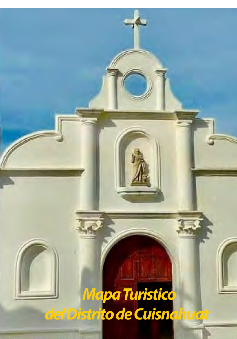
Mapa Turístico del Distrito de Cuisnahuat