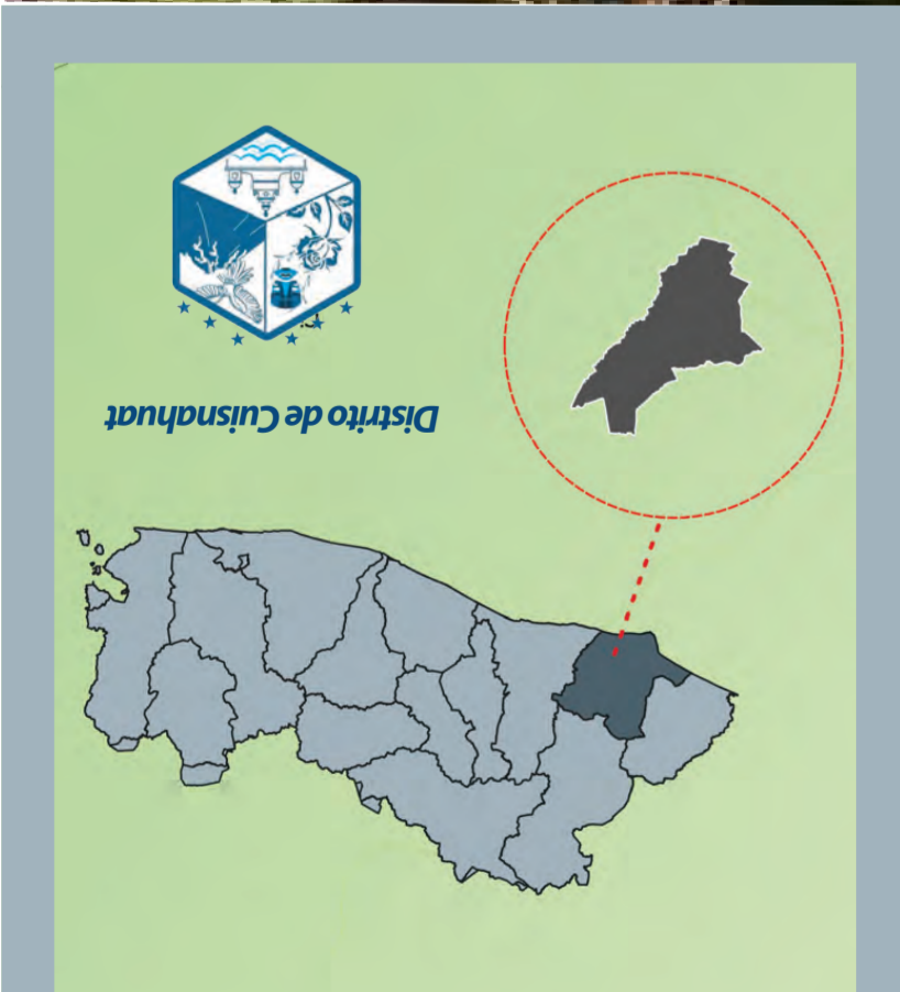
Plan de Desarrollo Turístico de la Microregion de los Izalcos 2024-2030